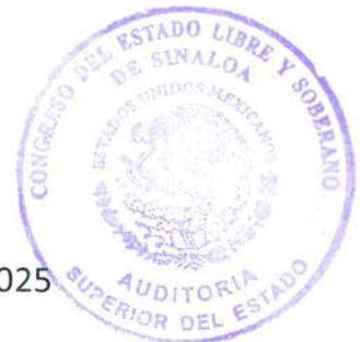
Lic. Emma Guadalupe Félix Rivera Auditora Superior del Estado de Sinaloa Culiacán Rosales, Sinaloa, a 20 de agosto de 2025

Así, este Órgano Técnico de Fiscalización informa al Congreso del Estado, por conducto de la Comisión de Fiscalización, del resultado de la auditoría practicada y, en su caso, de las irregularidades o deficiencias detectadas, además de las acciones y recomendaciones emitidas, las cuales quedarán promovidas al momento de su notificación a la entidad fiscalizada; por lo que, en cumplimiento a lo dispuesto en los artículos 8 fracción VII, 22 fracciones IX, XII, XV y XV Bis, 40 último párrafo, 49, 49 Bis fracciones II, III y V, 69 Bis, 69 Bis A y 69 Bis B de la Ley de la Auditoría Superior del Estado de Sinaloa, hago entrega del presente Informe Individual de la Revisión y Fiscalización Superior de los Recursos Públicos de la Junta Municipal de Agua Potable y Alcantarillado de Guasave , correspondiente al ejercicio fiscal 2024.