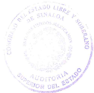
Lic. Emma Guadalupe Félix Rivera Auditora Superior del Estado de Sinaloa Culiacán Rosales, Sinaloa, a 04 de agosto de 2025

Así, este Órgano Técnico de Fiscalización informa al Congreso del Estado, por conducto de la Comisión de Fiscalización, del resultado de la auditoría practicada y, en su caso, de las irregularidades o deficiencias detectadas y las recomendaciones emitidas, las cuales quedarán promovidas al momento de su notificación a la entidad fiscalizada; por lo que, en cumplimiento a lo dispuesto en los artículos 8 fracción VII, 22 fracciones IX, XII, XV y XV Bis, 40 último párrafo, 49, 69 Bis, 69 Bis A y 69 Bis B de la Ley de la Auditoría Superior del Estado de Sinaloa, hago entrega del presente Informe Individual de Auditoría sobre el Desempeño realizada al Programa presupuestario I097 Dengue para el ejercicio fiscal 2024, operado por los Servicios de Salud de Sinaloa .